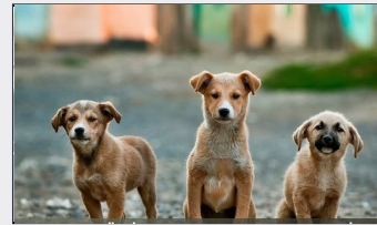
Türkiye'de Hayvan Haklarının Hukuki Boyutu