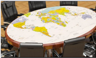
2023 Dış Politika Raporu