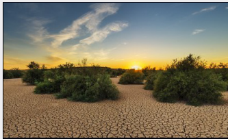
Doğu Akdeniz'de İklim Politikası Diyalogu daha önemli