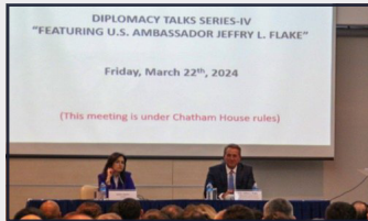
Büyükelçi Jeffrey L. Flake TEPAV'da Türk-Amerikan ilişkilerinin son durumu hakkında konuştu