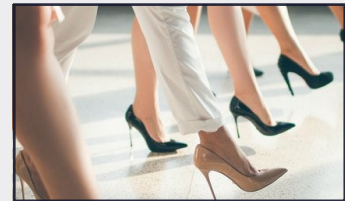
Ekonomide toplulukların ayak sesleri