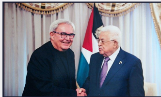
Filistin Devlet Başkanı Mahmut Abbas TOBB ve TEPAV yetkilileriyle buluştu