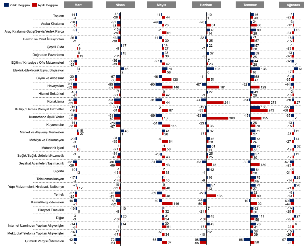
Şekil 2 Banka kartı ve kredi kartı ile yapılan harcama tutarının aylara göre aylık ve yıllık değişimleri, %, Mart – Ağustos 2020

Ağustos ayında bir önceki aya göre harcamalar en fazla konaklama sektöründe artarken, kumarhane/içkili yerler ve eğitim/kırtasiye/ofis malzemeleri sektörlerinde sınırlı bir artış görüldü. En fazla azalış ise kulüp/dernek/sosyal hizmetler, kamu/vergi ödemeleri ve giyim ve aksesuar harcamalarında görüldü. Yıllık bazda en fazla artış elektrik-elektronik eşya, müteahhitlik işleri ve telekomünikasyon harcamalarında görüldü. Kamu/vergi ödemeleri, seyahat acenteleri/taşımacılık, kulüp/dernek/sosyal hizmetler ve havayolları harcamaları ise en fazla azalış görülen sektörler oldu. Alışveriş yöntemi bakımından incelendiğinde ise ağustos ayında internet üzerinden yapılan alışverişler, Ağustos 2019'a göre yüzde 6, Temmuz 2020'ye göre yüzde 22 azaldı.