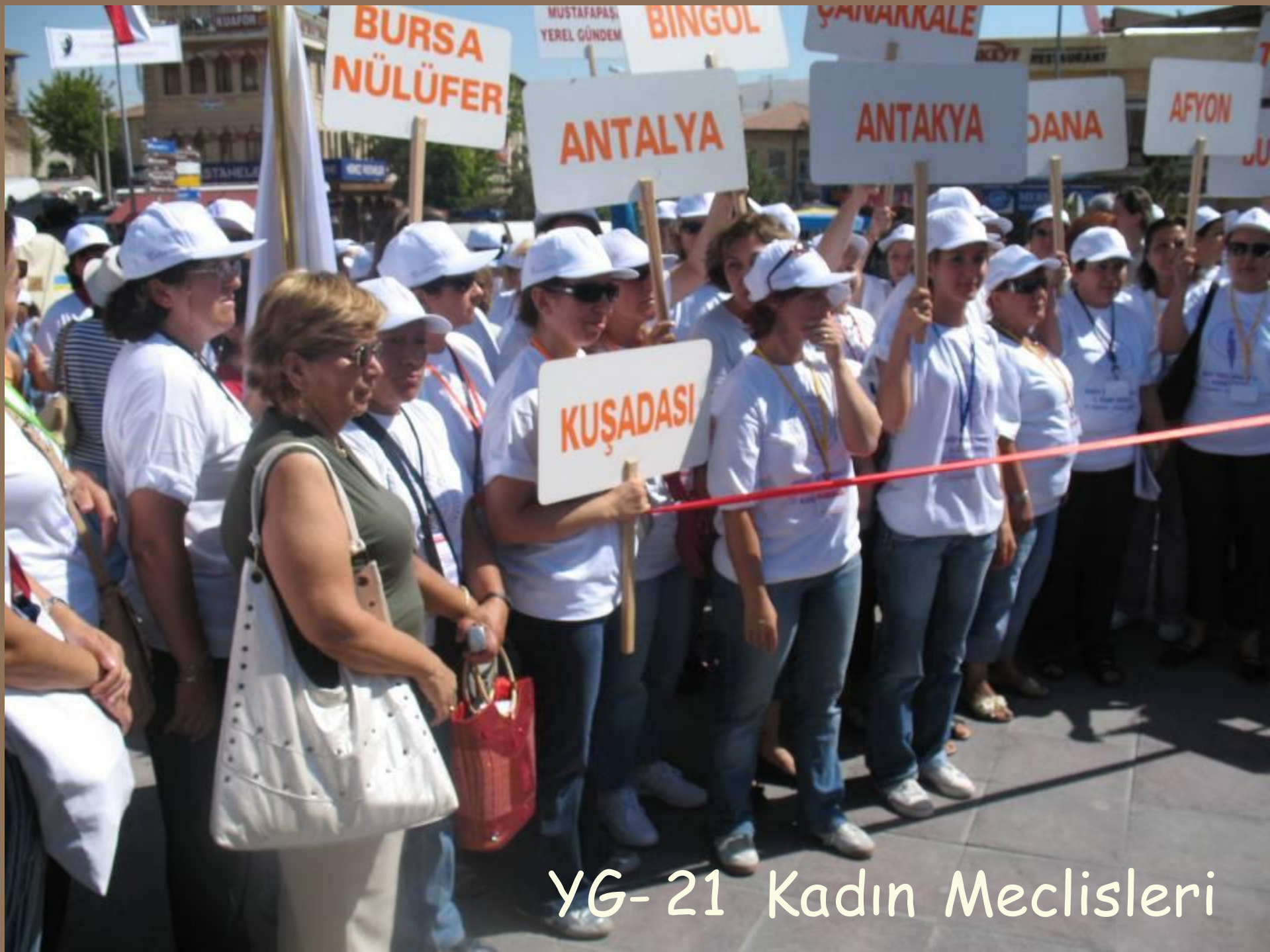
YG-21 Kadın Meclisleri