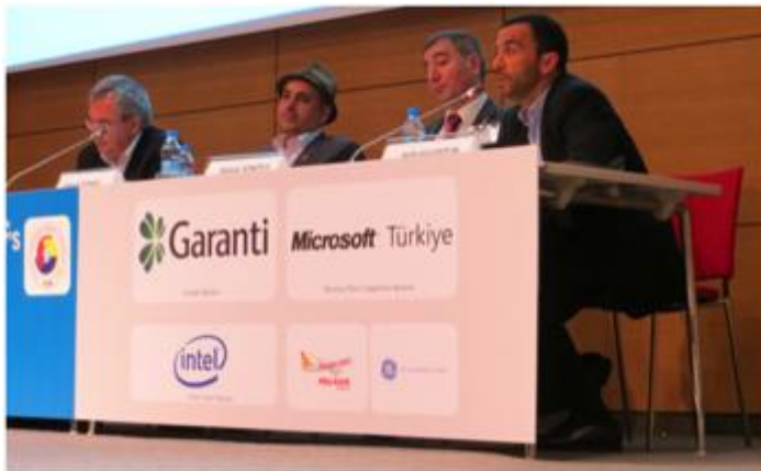
Above: Delegates judge Turkish startups during the “Showcase competition

fashion, biomedical products, and image processing.