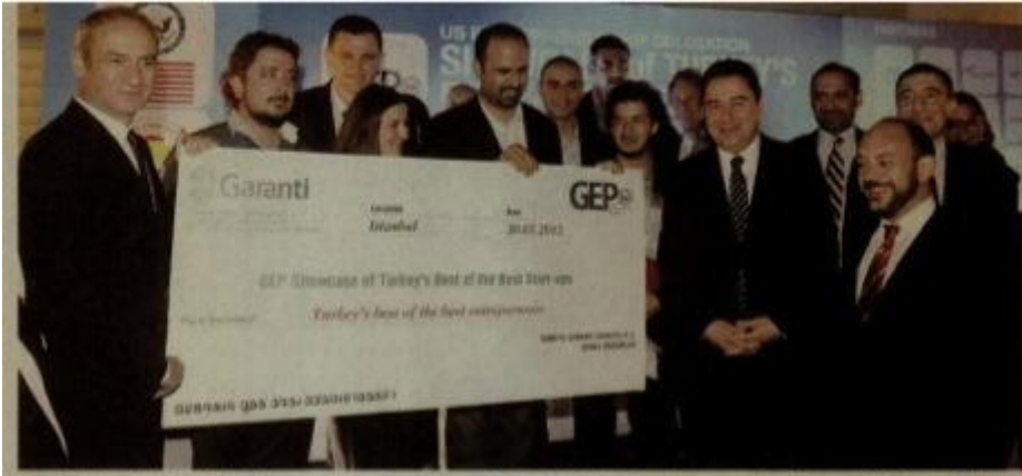
Deputy Prime Minister Ali Babacan poses with winners of the 'Turkey's best entrepreneur business models' competition.